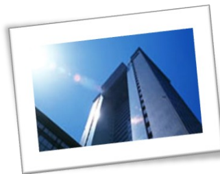
法政大学市ヶ谷キャンパス ボアソナードタワー26階 スカイホール